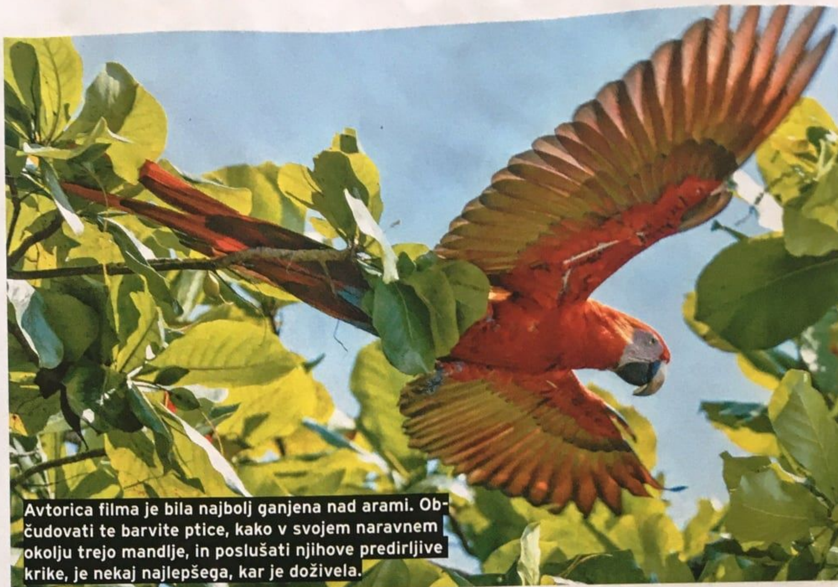
Avtorica filma je bila najbolj ganjena nad arami. Občudovati te barvite ptice, kako v svojem naravnem okolju trejo mandlje, in poslušati njihove predirljive krike, je nekaj najlepšega, kar je doživela.

Domačini, ki smo jih srečali, so navajeni raziskovalcev in snemalnih ekip. Bili so zelo prijazni in z veseljem ugodili vsem našim željam in potrebam. Zaposleni na