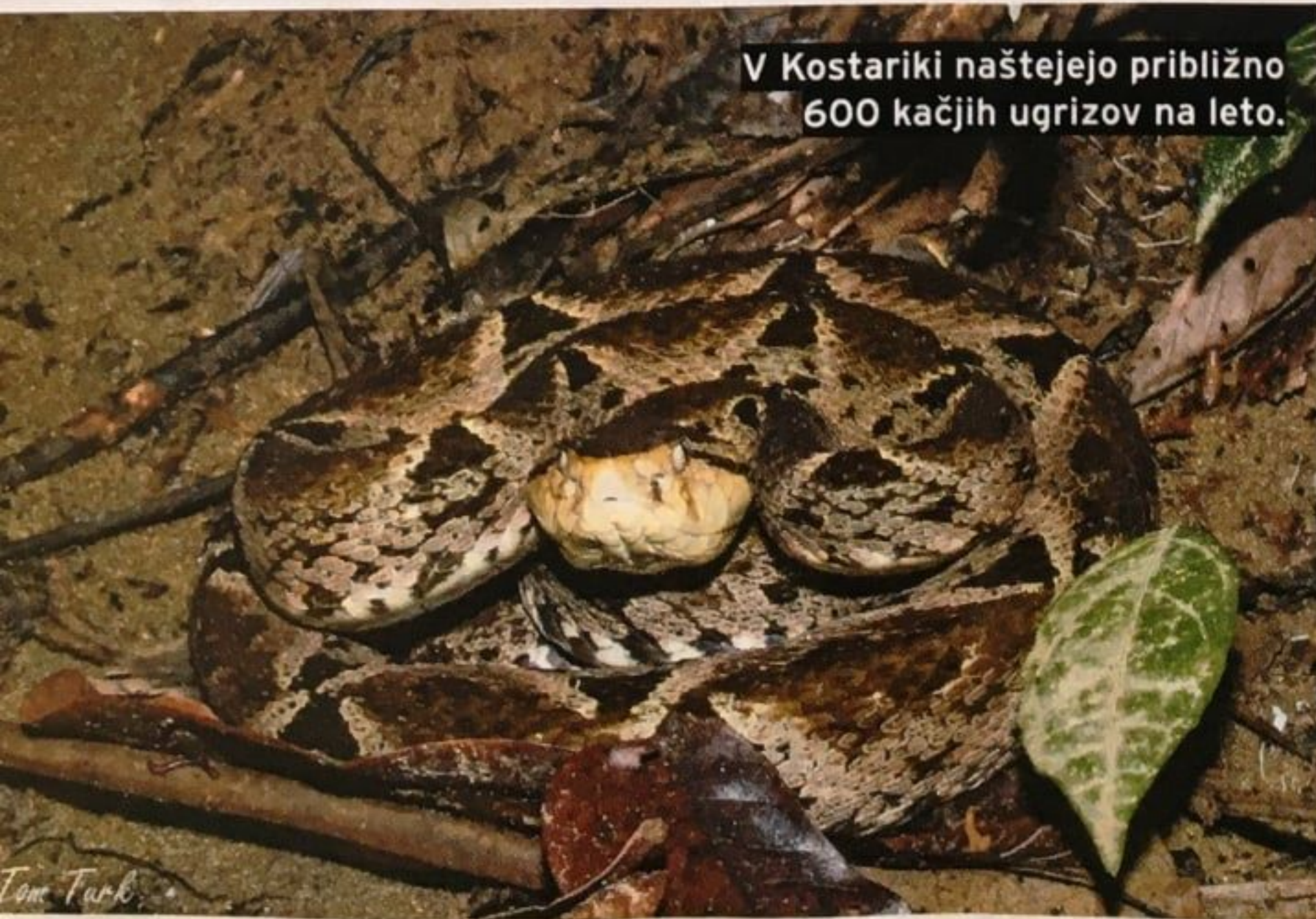
V Kostariki naštejejo približno 600 kačjih ugrizov na leto.

Teja Pelko