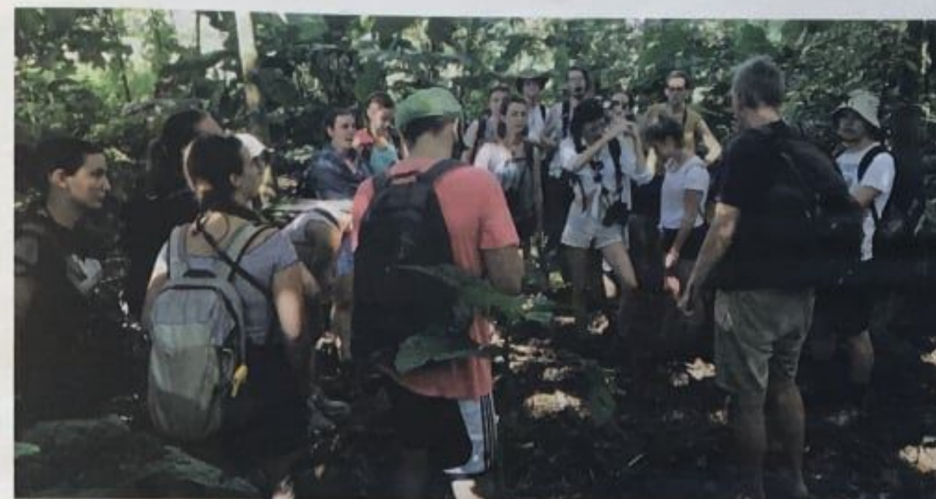
Slovenski študentje v Kostariki spoznavajo tropski deževni gozd.

Priprave na snemanje so začeli decembra lani, snemala sta konec januarja in v začetku februarja, torej pozimi. Takrat je v Kostariki suho obdobje, kar pomeni, da je deževalo bolj poredko kot sicer, temperature pa so bile ob značilni zelo visoki vlažnosti približno 30 stopinj Celzija.