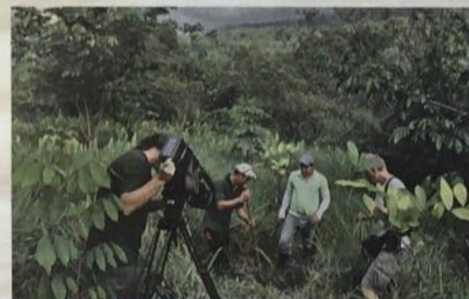
Pri vračanju degradiranih kmetijskih zemljišč naravi sodelujejo domačini in Avstrijci.

Tako kot povsod v tropski naravi pa je tudi v Kostariki veliko kač. Ena od strupenih, celo smrtonovarnih, je ugriznila enega od študentov. »Imeli smo srečo, da je bil na tropski postaji avto, ki sicer ni vedno tam. Vodja postaje je študenta odpeljal v najbližjo bolnišnico, pol ure stran. Tam je dobil več odmerkov protistrupa in kup tablet ter ostal pod nadzorom čez noč. Na srečo se je vse dobro izteklo. V Kostariki imajo približno 600 ugrizov strupenih kač na leto, vendar število smrtnih primerov pada, ker v glavnem mestu San José deluje inštitut Clodomira Picada, na katerem izdelujejo protistrupe za vse vrste strupov tamkajšnjih kač.«